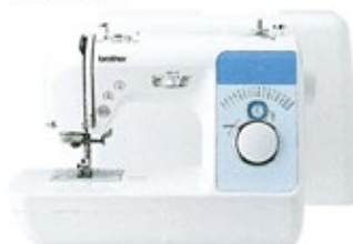
※ハードケース付き