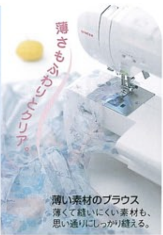
薄い素材のブラウス 薄くて縫いにくい素材も、思い通りにしっかり縫える。

30年以上も愛され続ける「モナミシリーズ」のやさしいフォルムはそのままに、さらに使いやすくシンプルなデザインにリニューアルしました。