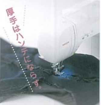
デニムのスカート みんなの好きなデニム素材のスカートも、軽い調子で楽しく縫える。フリルなどの重ね縫いも、楽々です。