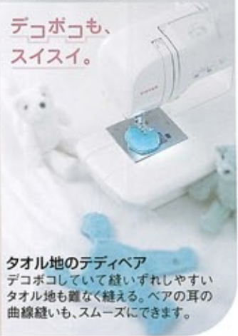
タオル地のティディベア デコボコして縫いづれしやすいタオル地も難なく縫える。ヘアの耳の曲線縫いも、スムーズにできます。